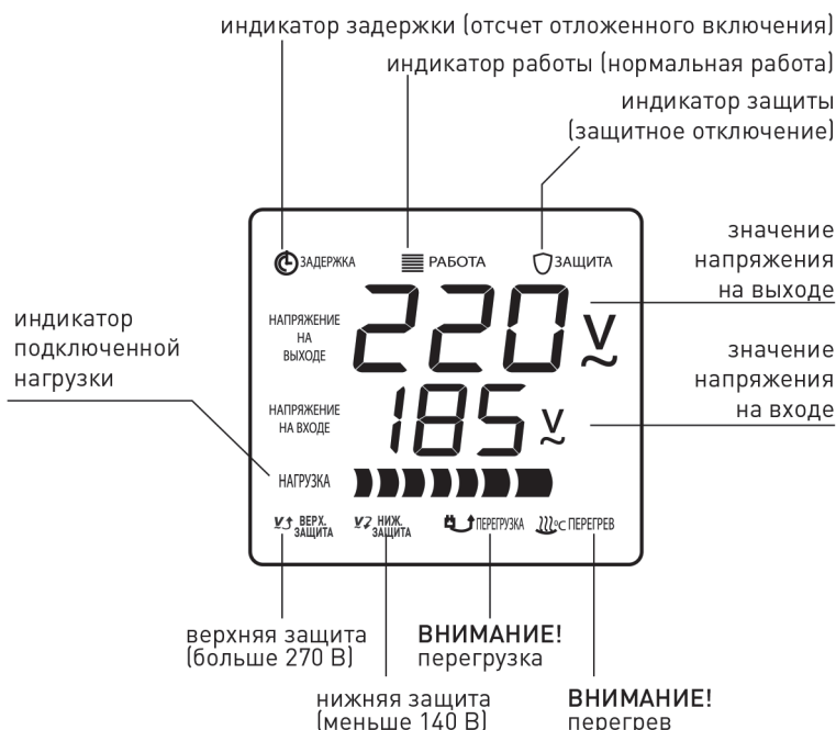
Индикация режимов работы стабилизатора.

При нормальной работе стабилизатора на индикаторе отображается режим « РАБОТА », величины выходного и входного напряжения и индикатор « НАГРУЗКА », по которому можно судить о загруженности прибора.