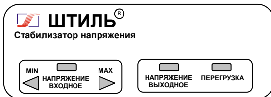
Рисунок 4.1 Передняя панель стабилизатора

На одной боковой стенке стабилизатора расположена розетка с заземляющим контактом для подключения нагрузки, а на другой – автоматический предохранитель 2А (у стабилизатора R250T) или 5А (у стабилизаторов R400T, R600T), или 10А (у стабилизатора R800T), выключатель СЕТЬ и выведен сетевой шнур для подключения стабилизатора к сети.